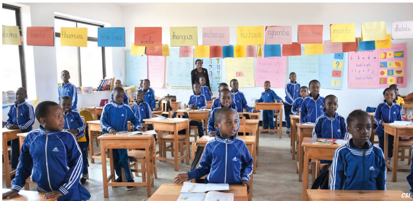
Les premiers élèves