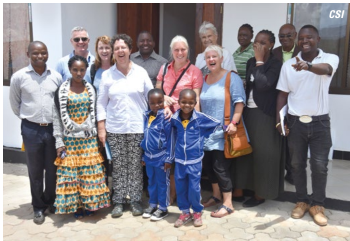
CSI et IOP Luxembourg en visit à Ilula