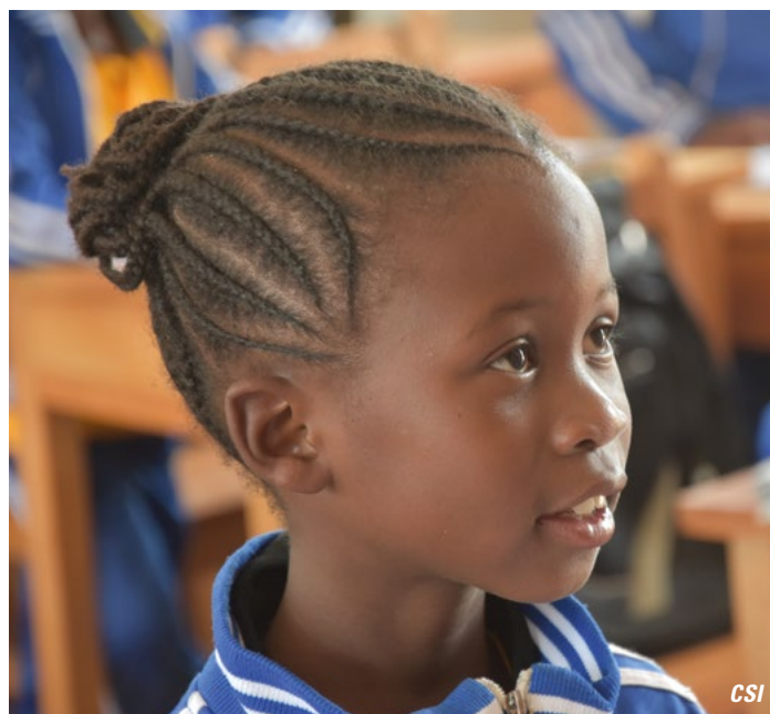
Une élève très attentive