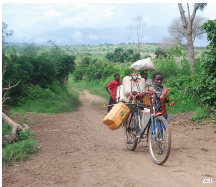
Un garçon en route pour aller chercher de l'eau