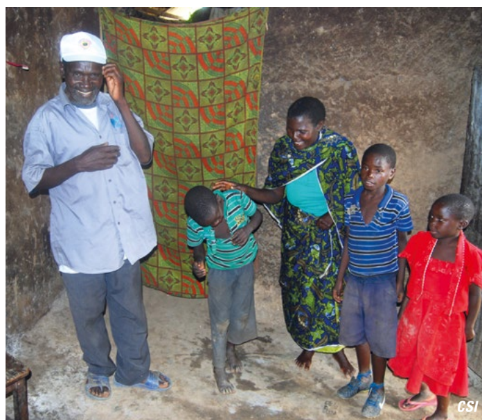
Visite à domicile chez les enfants avec leur mère aveugle