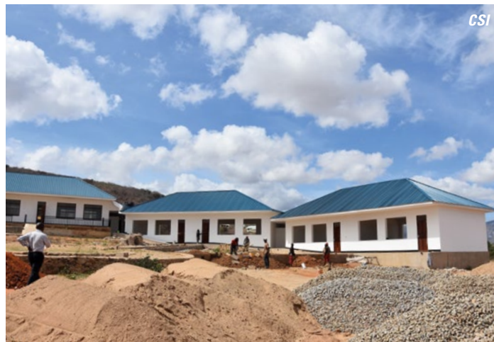
L'école primaire en construction

sauf dans les écoles secondaires. Cette lacune linguistique amène les élèves du secondaire à devoir relever de grands défis pour gérer les matières et souvent ils n'arrivent pas à suivre correctement les cours. IOP estime que l'éducation offerte au sein de cette nouvelle école primaire contribuera sans aucun doute à donner aux enfants de meilleures chances dans la société.