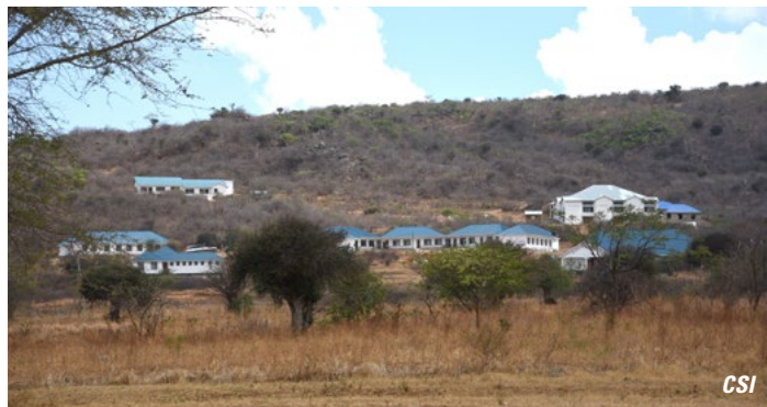
Vue d'ensemble des infrastructures scolaires avec au milieu la nouvelle école primaire

L'autre élément est la langue d'enseignement qui est l'anglais. Dans le district de Kilolo, aucune école n'utilise l'anglais comme moyen d'instruction